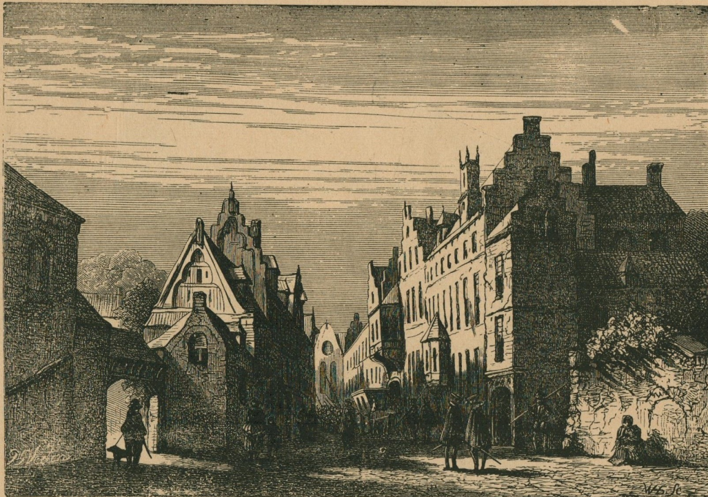
208. — L'hôtel de Culembourg, où se tint le banquet des Gueux, le 6 avril 1566, et où résida le duc d'Albe à son arrivée à Bruxelles.

Kasteel van Culembourg, waar het feestmaal der Geuzen plaats greep, den 6 n April 1566, en dat bewoond werd door den hertog van Alva bij zijne aankomst te Brussel.